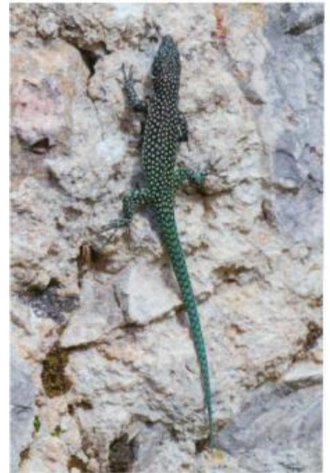
Brilleneidechse Scelarcis perspicillata und Maurische Landschildkröte Testudo graeca graeca in den Ruinen von Volubilis.