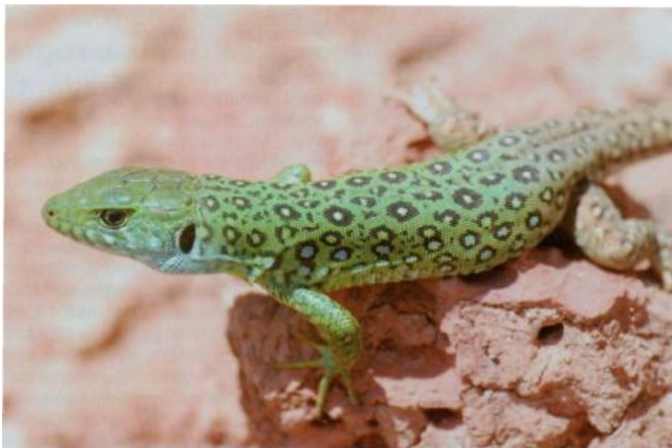
In Marokko nördlich des Hohen Atlas lebt die Perleidechse Timon tangitanus . Hier ein nicht ganz halbwüchsiges Tier mit kontrastreicher Zeichnung.

ten wir an den typischen Hochgebirgsvertretern dieser Artengruppe nur den Bergwalzenskink Chalcides montanus und einen der beiden endemischen Taggeckos, Quedenfeldtia trachyblepharus finden. Zwei ebenfalls endemische - das heißt nur hier vorkommende - Arten, die Atlaseidechse Atlantolacerta andreansky und die Atlaszergviper Vipera monticola , blieben uns wegen des in höheren Lagen sehr schlechten Wetters verborgen.