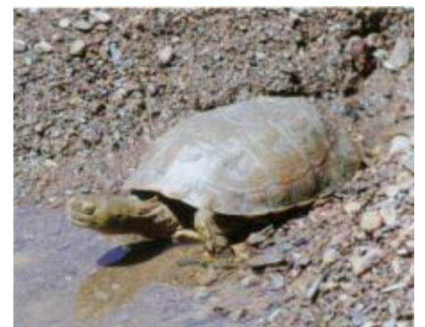
Die Spanische Wasserschildkröte Mauremys leprosa wernerkaestlei .

nur Marokkanische Mauereidechsen Podarcis vaucheri fanden, bis nach Volubilis, in der Nähe der Königsstadt Meknes durch. In den Ausgrabungen der größten Stadt des Römischen Reiches in Nordwestafrika fanden wir dann die Brilleneidechse