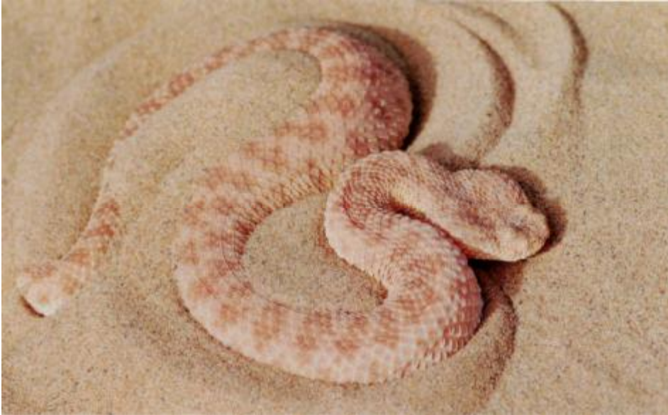
Die Avicennaviper Cerastes vipera ist eine Bewohnerin der freien Sandflächen in den Dünen. Hier bewegt sie sich seitenwindend fort.