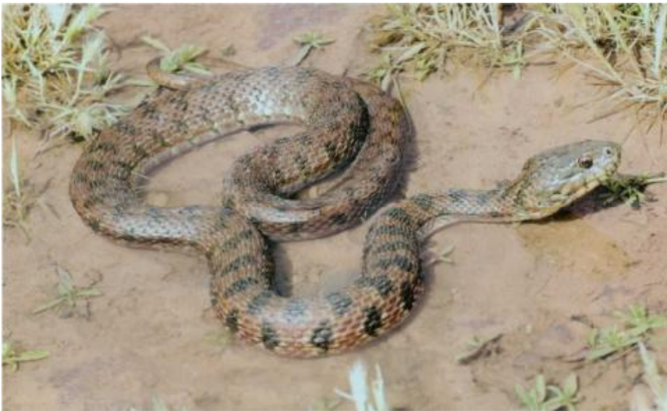
Die Vipernatter Natrix maura bewohnt viele der Gewässer Marokkos, ob fließend oder stehend.