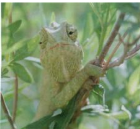
Das Europäische Chamaeleon lebt in den Halbwüstengebieten Südmarokkos ausschließlich in buschbestandenen Bachtälern (Wadis).

Wir besuchten die beiden imposanten Schluchten des Dades und der Todra. Kurz darauf in östlicher Richtung geht die Hammada in den „Reg“ über. Diese meist topfebene Kiesfläche, die über 50 Prozent der Gesamtfläche der Sahara ausmacht, zählt zu den eintönigsten und lebensfeindlichsten Landstrichen unserer Erde. So suchten wir nur an sehr wenigen Stellen, wo kleine trockene Fluss- oder Bachtäler die Kiesebene durchschneiden. An Neuigkeiten fanden wir nur den kleinen Gecko Tropiocolotes (tripolitanus) algericus .