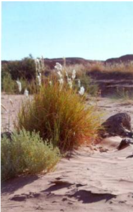
Der Ziz versickert in der Wüste westlich des Erg Chebbi. Er ist wohl nie in einen anderen Fluss gemündet oder hat das Meer erreicht.

Der Ort Merzouga am Erg Chebbi war auch der letzte gemeinsame Aufenthalt der gesamten Truppe. Die Flugzeug-Gruppe musste nun den Rückweg nach Casablanca, ihrem Abflughafen antreten.