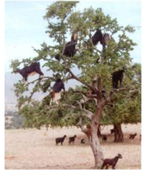
Weidewirtschaft auf marokkanisch. Durch die extreme Überweidung finden die Ziegen auf dem Boden praktisch nichts mehr zu fressen. So müssen sie sich an die grünen Blätter der Eisenholzbäume Argania spinosa halten.

Nun begann auch für uns langsam die Rückreise. Diese führte uns ent-