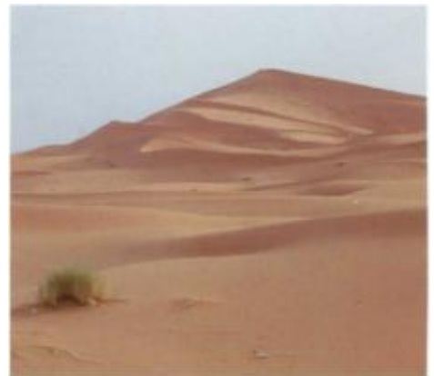
Die Sanddünen des Erg Chebbi sind die größten Wanderdünen Marokkos.