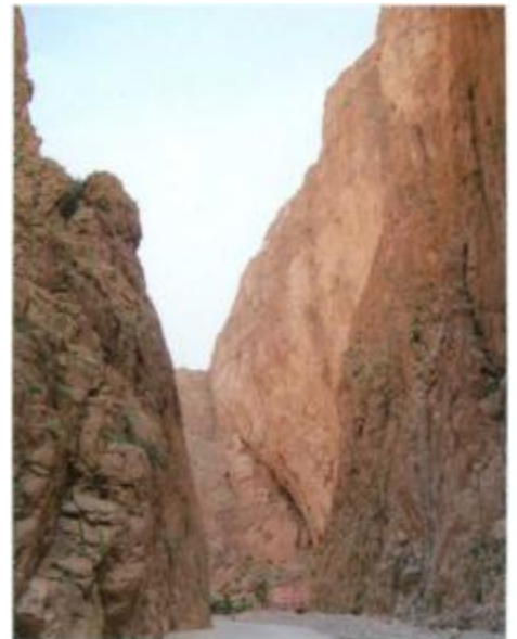
Die Todraschlucht zählt zu den landschaftlichen Höhepunkten Marokkos.