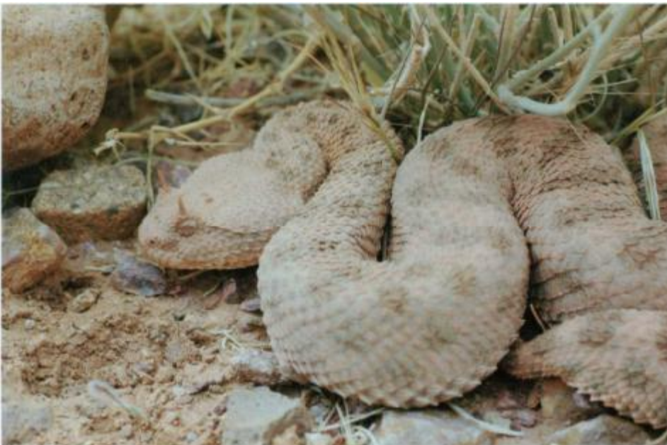
Die Viper der Felswüsten. Cerastes cerastes bewohnt hier bevorzugt Fluss- und Bachtäler, wo feiner Sand vorkommt.