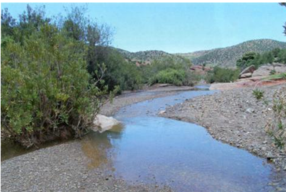
Lebensraum der Spanischen Wasserschildkröte nach der Ortschaft Mrirt.