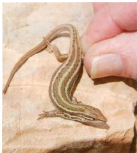
Der Grüne Sandläufer Psammodromus microdactylus zählt zu den seltensten Reptilien der Welt.

Scelaris perspicillata , die Atlasagame Agama bibronii , Mauergeckos Tarentola mauritanica , afrikanische Perleidechsen Timon tangitanus und Maurische Landschildkröten Testudo graeca graeca . Auf der Straße neben überfahrenen Landschildkröten auch das erste, dem Verkehr zum Opfer gefallene Chamaeleon Chamaeleo chamaeleon .